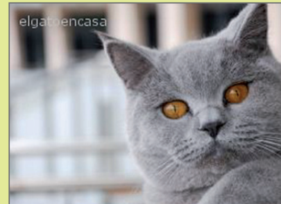
Gato del mes de julio: "Blau". Propietaria: Sonia Galbas Linares.